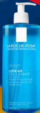
LA ROCHE-POSAY Gel Lavant dušas zeleja, 750 ml