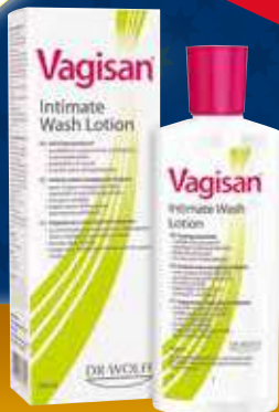
VAGISAN Intimate Wash Lotion losjons intīmai higiēnai 200 ml