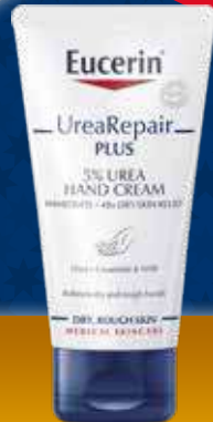
Eucerin 5% UREARepair Plus roku krēms saurai ādai 75ml