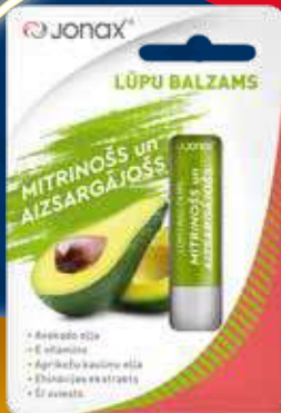
JONAX Mitriņošs un aizsargājošs lūpu balzams balzams lūpām 4.5 g