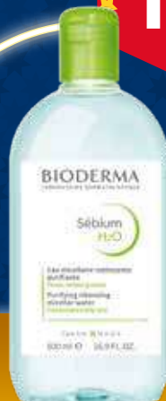
BIODERMA Sebum H2O micelārais ūdens 500 ml